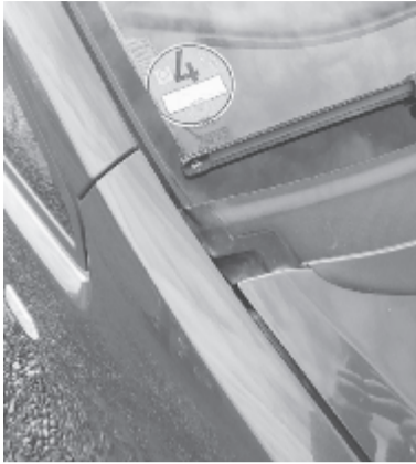
Németországban kötelező az emissziós matrica kiragasztása

A régi viszonteladók nem örömhír a regisztrációs adó eltörlése. Szerintük a piac ismét feltelik '96-97-es évjáratú autókval, amelyeket olcsón, pár száz euróért már meg lehet venni, de „annyit is érnek”. „Akármennyire vigyáztak is ezekre, egy több mint húszéves autót kikezd a rozsdá, a fenntartásukra, javításukra sokat kell költeni. Egy-két évig még futnak, aztán roncsleplepre kerülnek”. Mások a regisztrációs illeték eltörlése mögött politikai-gazdasági manővert sejtnek, aminek eredményeképpen a nyugati országok, főleg Németország megszabadul a buy-back rendszerben