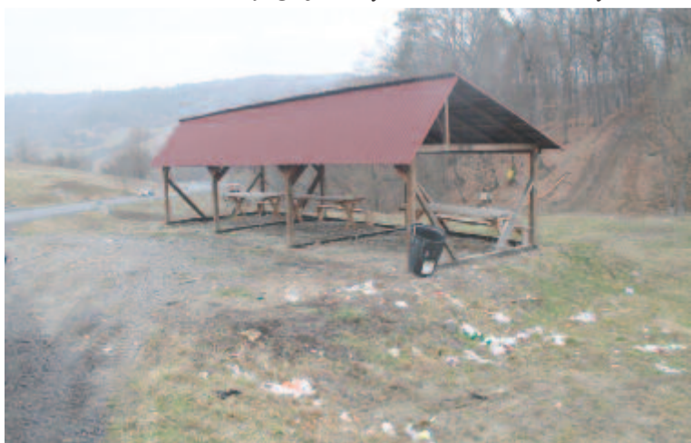
A tervezett piac

Az igazgatóról arról is tájékoztatót, hogy idén összesen 12 előkészítő kezdte majd az iskolát a községgazdálkodásban. A nyárádselelyi szülők kérték, hogy a szeptemberre iskolaéretté váló gyermekeik is Magyaróson tanulhassanak, őket majd iskolabusz hozza-viszi.