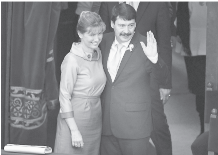
Áder János és felesége, Herczegh Anita

Először 2012. május 2-án választotta elnökké az Országgyűlés, majd – a rendszerváltás utáni ötödik államfőként – 2012. május 10-én lépett hivatalba.